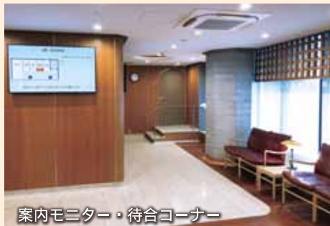
案内モニター・待合コーナー

館内案内モニターにもご参拝いただく参拝室の部屋番号が表示されます。また混雑時には順番にご案内しますので、待合コーナーでおくつろぎください。